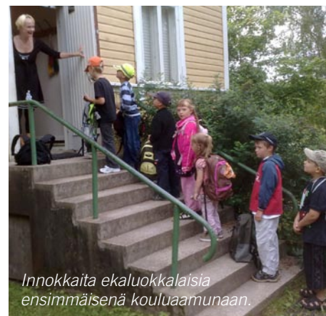
Innokkaita ekaluokkalaisia ensimmäisenä kouluuamunaan.